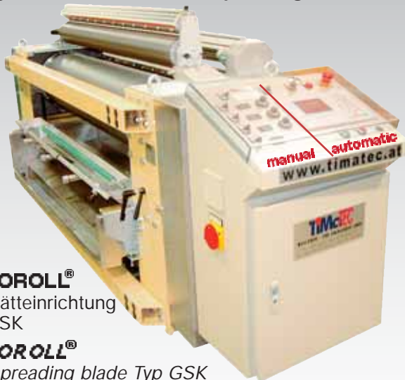
VARIOROLL® mit Glätteinrichtung Typ GSK

Maschine sowohl für manuellen wie auch vollautomatischen Betrieb mit SIMATIC - Steuerung ausgestattet. Coating machine for manual operating as well as for automated operation with SIMATIC-control unit.