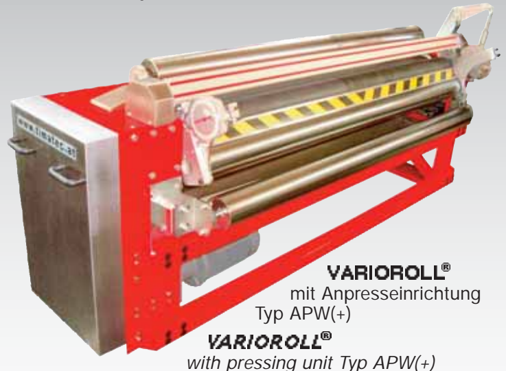
VARIOROLL® mit Anpresseinrichtung Typ APW(+)

VARIOROLL® with pressing unit Typ APW(+)