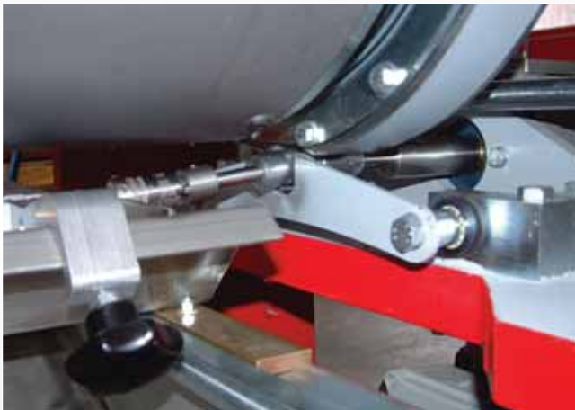
Überlaufwanne mit wenig Inhalt - 5L/lfm. Variabler Dosierrollenantrieb. Overflow tray with small content - 5L/rm Variable drive of the Dosingroll.

VARIOROLL® with pressing unit Typ APW(+)