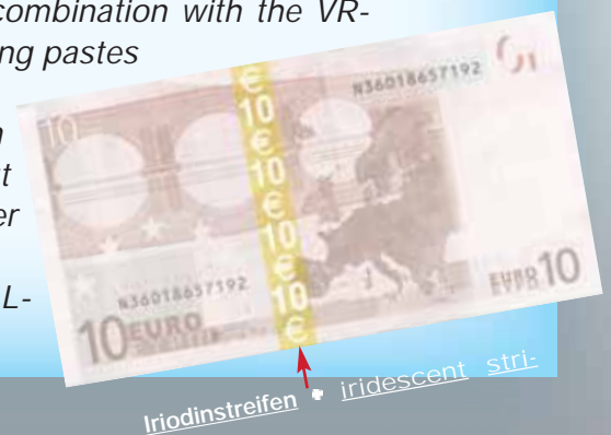
Iridinstreifen • iridescent stri-

This new development has been specially designed for the combination with the VR-System, with great reliability in production. Solvent-based printing pastes can be used also. The printing station can be arranged horizontal, angled or horizontally. It can be equipped with Magnetroll-System , Magnetsqueegee-System , or without Magnetsystem. The printing paste can be applied as a thin layer as well as voluminous. Production speed up to 130 m/min. For full-surface application the VARIOROLL- or ROLL on ROLL-System can be delivered additionally.